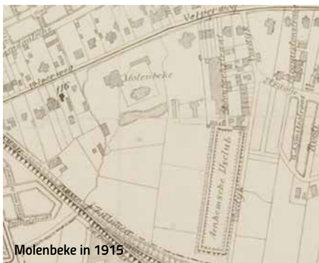
Molenbeke in 1915

Op oude kaarten uit 1874, 1915, 1985 en 2019 zijn de ruimtelijke ontwikkelingen in Molenbeke goed te zien. Op de oudste kaart zien we het Staatsspoor van Arnhem naar Zutphen liggen. De Molenbeek stroomt in 1874, net als nu, door het grondgebied van onze wijk. Het landhuis Molenbeke met park en vijver is dan eigenlijk de enige bebouwing.