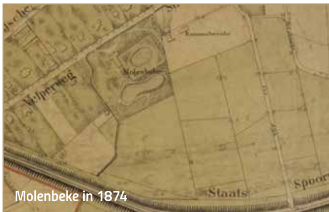
Molenbeke in 1874

Langzaam maar zeker werden de weilanden omgezet in bouwgrond en zo ontstonden de wijken Presikhaaf, Plattenburg en Molenbeke.