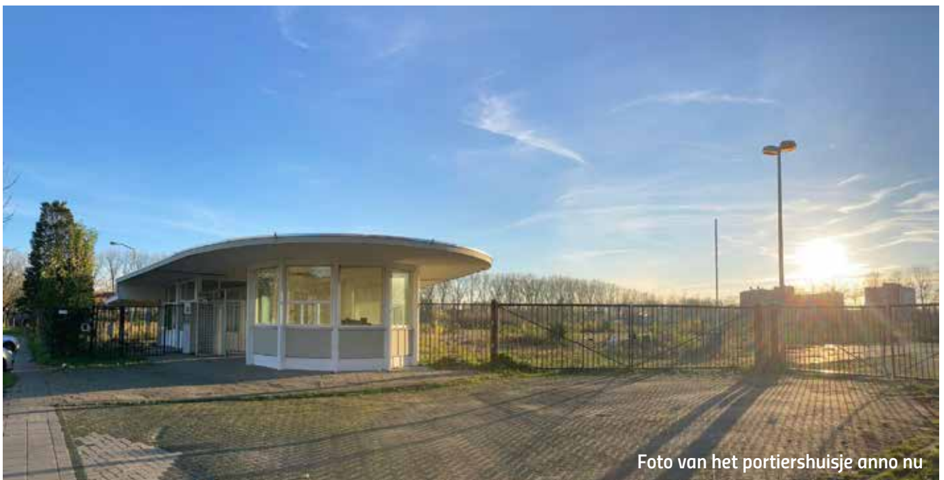
Foto van het portiershuisje anno nu

Kijk voor meer informatie op moesarnhem.nl en via instagram @Moesarnhem kun je alle ontwikkelingen volgen. Hier kondigen we ook de tijden en het programma van het openingsfeest aan; hopelijk tot dan!