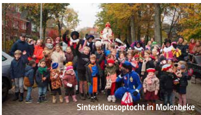
Sinterklaasoptocht in Molenbeke

Een week later bracht de Sint met zijn Pieten een bezoek aan de wijk. Dit jaar reed hij op zijn witte schimmel door de straten van Molenbeke. Het was een prachtig gezicht; de mannen van de Bloospoeperij liepen voorop en speelden alle populaire Sinterklaas-meezingers.