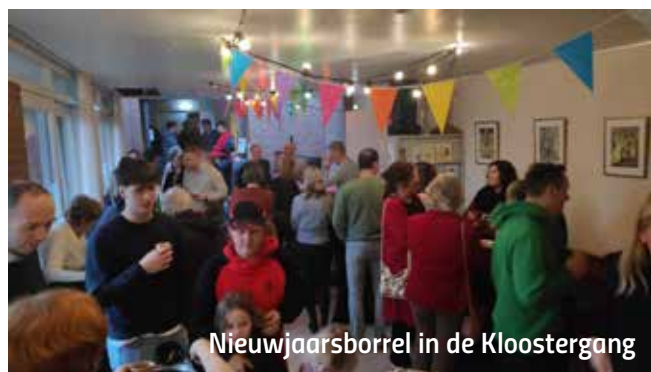
Nieuwjaarsborrel in de Kloostergang

De regen kwam met bakken uit de lucht. Tot het laatste moment was er de hoop dat het droog zou worden of dat we tenminste droog onder een tent zouden kunnen staan, maar het mocht niet zo zijn.