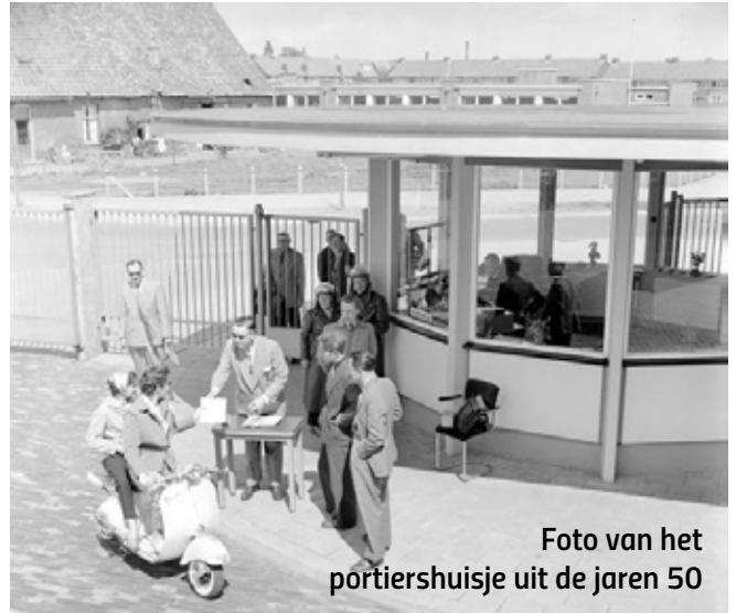
Foto van het portiershuisje uit de jaren 50

Samen met buurtbewoners maken we Moes de gezelligste plek van de wijk. Wil je meeklussen, meedoen, meehelpen? Heb je bijvoorbeeld groene vingers? Of zou je een activiteit willen opzetten en/of begeleiden?