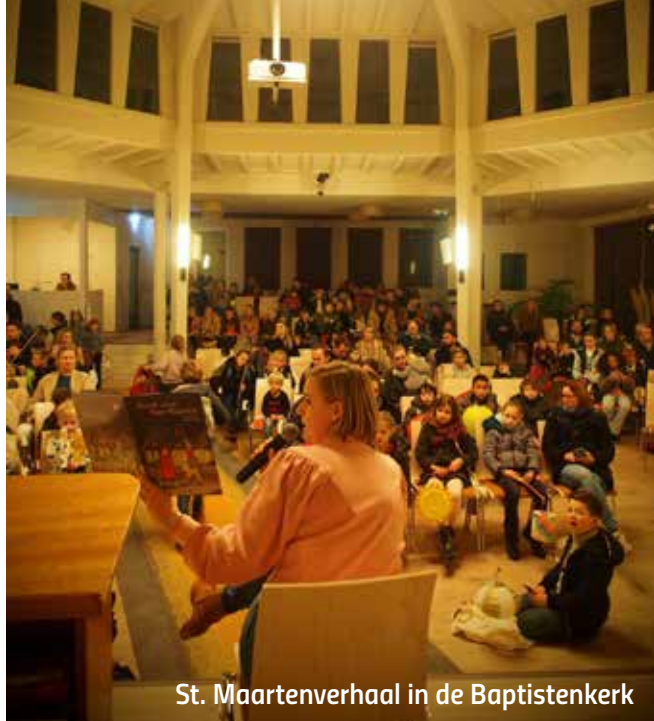
St. Maartenverhaal in de Baptistenkerk