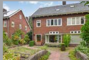
Laan van Klarenbeek 61 Arnhem