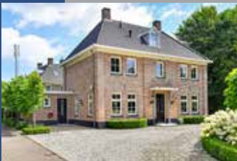
Achterstehoek 9 Duiven

Makelaars huys Kuyk van Oldeniel is de actieve woningmakelaar voor uw wijk, al sinds 1935! Wij beschikken over een groot netwerk van woningzoekers die geïnteresseerd zijn in misschien wel uw woning. Wilt u ook graag weten wat uw woning kan opbrengen, maak dan met ons een afspraak voor een uitgebreid maar vrijblijvend verkoopadvies. Stille verkoop behoort ook tot de mogelijkheden, wij bereiken daarbij vaak uitstekende resultaten. Als gespecialiseerde aankoopmakelaar kunnen wij u daarnaast uiteraard van dienst zijn bij de zoektocht naar een nieuwe droomwoning. Hieronder vindt u een kleine selectie uit ons aanbod, wij maken graag een afspraak voor een bezichtiging!