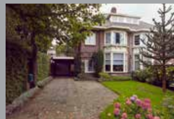
Velperweg 142 Arnhem