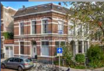
Annastraat 4 Arnhem,