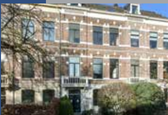
Boulevard Heuvelink 201 Arnhem