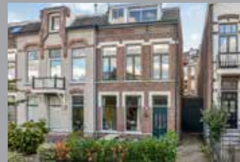
Burgemeester Weertsstraat 61 Arnhem